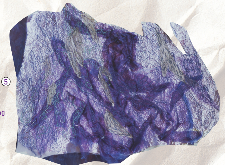
Zilverpapier als tussenlaag

kleine delen van de zak afkreeg. Ze waren echter zo mooi doorschijnend dat ik ook daar een quiltje van maakte [zie foto 6]. Met de papierpulp moet ik nog wat verder experimenteren. Misschien dat ik daar een volgende keer verslag van doe.